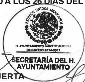
YOLANDA DEL CARMEN OSUNA HUERTA PRESIDENTA MUNICIPAL

EN CUMPLIMIENTO A LO DISPUESTO POR LOS ARTÍCULOS 65 FRACCIÓN II DE LA LEY ORGÁNICA DE LOS MUNICIPIOS DEL ESTADO DE TABASCO; 14 DEL REGLAMENTO DE LA ADMINISTRACIÓN PÚBLICA DEL MUNICIPIO DE CENTRO, TABASCO Y 22 FRACCIÓN X DEL REGLAMENTO DEL HONORABLE CABILDO DEL MUNICIPIO DE CENTRO, TABASCO, EN LA CIUDAD DE VILLAHERMOSA, CAPITAL DEL ESTADO DE TABASCO, RESIDENCIA OFICIAL DEL HONORABLE AYUNTAMIENTO CONSTITUCIONAL DEL MUNICIPIO DE CENTRO, TABASCO, PROMULGO EL PRESENTE ACUERDO A LOS 26 DÍAS DEL MES DE NOVIEMBRE DEL AÑO 2024, PARA SU PUBLICACIÓN.